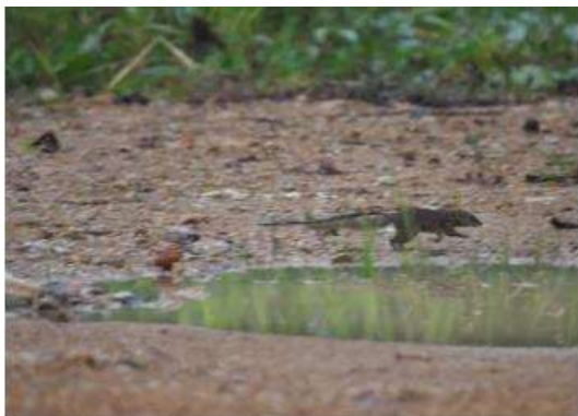
กระแตไต่ (Tupaia glis)