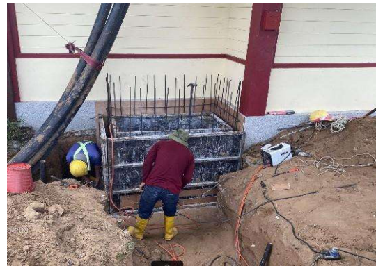
บริเวณสถานีสวนสนประดิพัทธ์