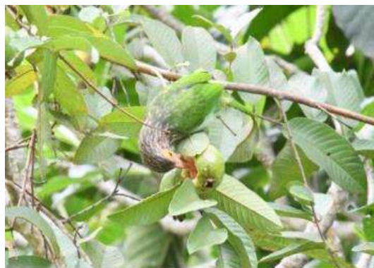
นกโพระดกธรรมดา ( Psilopogon lineatus )