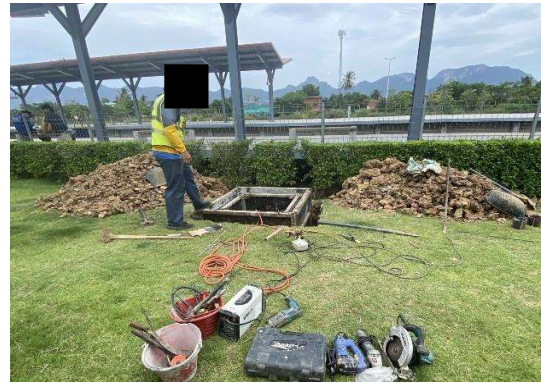
บริเวณสถานีสามร้อยยอด