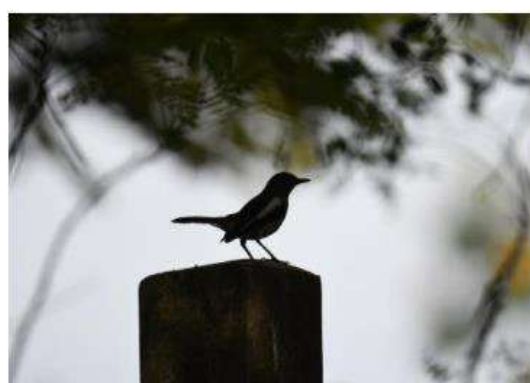
นกกาขเหนบ้าน ( Copsychus saularis )