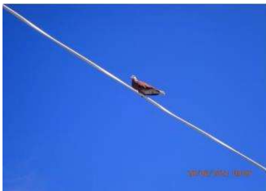
นกเขาไฟ ( Streptopelia tranquebarica )