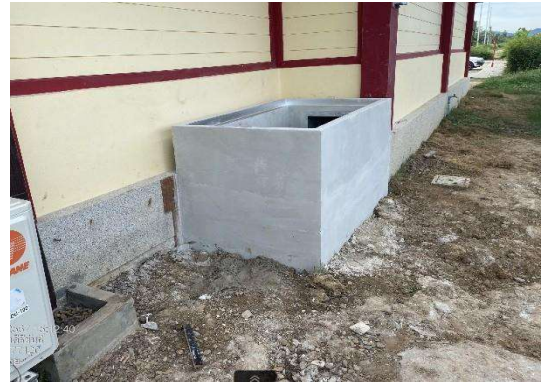
บริเวณสถานีวังคัพ