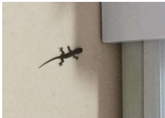
ตุ๊กแกบ้าน ( Gekko gekko )