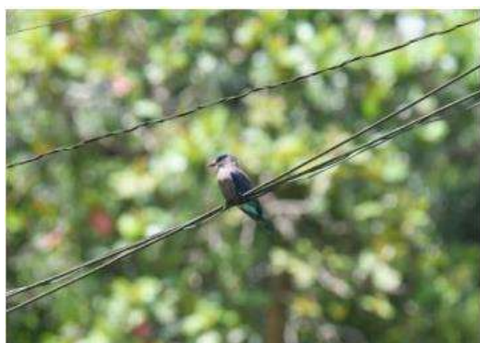
นกตะขาบทุ่ง ( Coracias benghalensis )