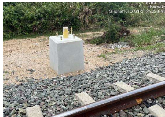
บริเวณสถานีเขาเต่า