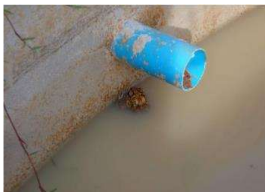
คางคกบ้าน ( Duttaphrynus melanostictus )