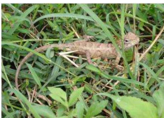
กิ้งก่าหัวแดง ( Calotes versicolor )