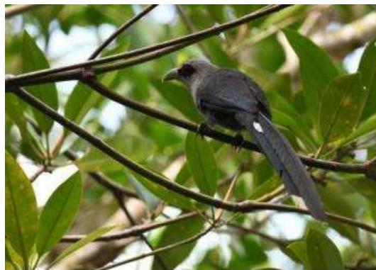
นกบั้งรอกใหญ่ ( Phaenicophaeus tristis )