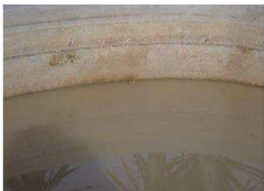
กบนา ( Hoplobatrachus rugulosa )