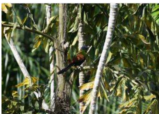
นกกะปูดใหญ่ ( Centropus sinensis )