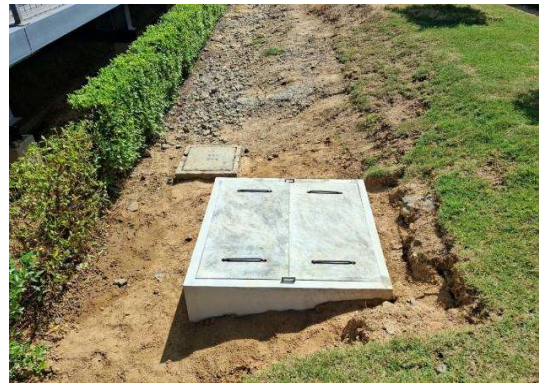
บริเวณสถานีคันกะไค