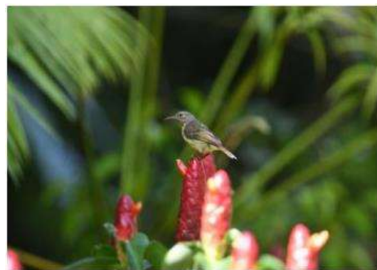
นกกาฝากสีเรียบ ( Dicaeum minullum )