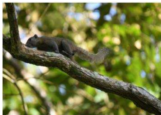
กระรอกปลายหางดำ (Callosciurus caniceps)