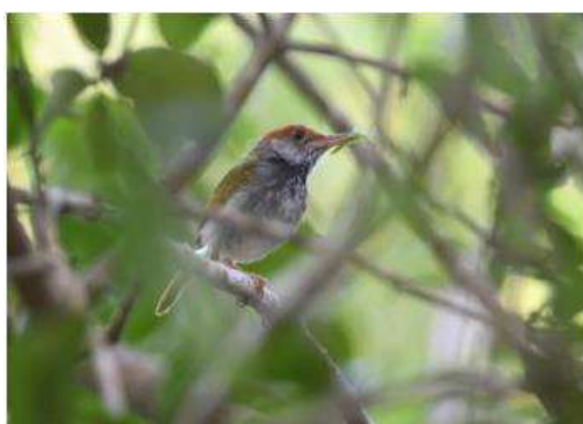
นกกระเจี๊ยบคอดำ ( Orthotomus atrogularis )