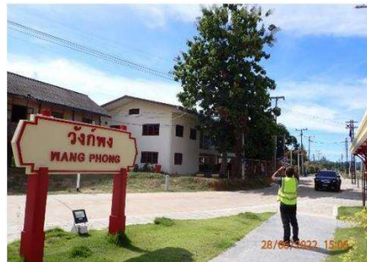
รูปที่ 3-3 การศึกษานิเวศวิทยาทางบก-สัตว์ป่าที่ผ่านมา