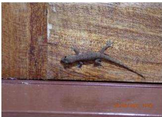
จิ้งจกหางหนาม ( Hemidactylus frenatus )