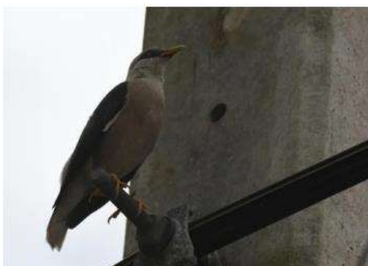
นกกิ้งโครงหัวสีนวล ( Sturnus burmannicus )