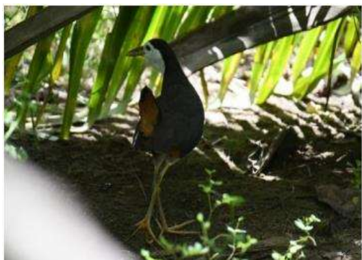
นกกรั้ว (Amauornis phoenicurus)