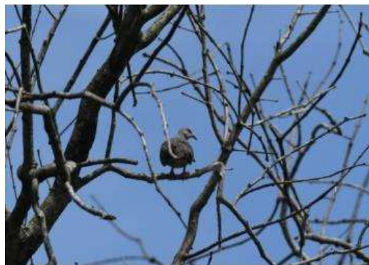
นกเขาใหญ่ (Steptopelia chinensis)