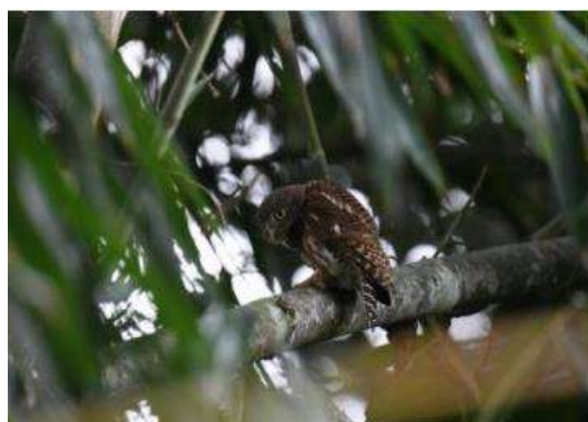
นกเค้าแมว ( Glaucidium cuculoides )