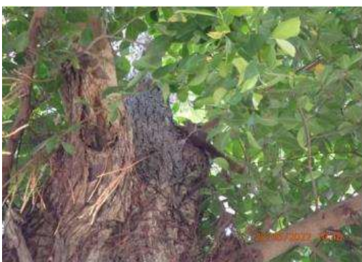
กระรอกท้องแดง (Callosciurus erythraeus)