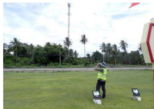
รูปที่ 3-3 (ต่อ) การศึกษาสิ่งแวดล้อมทางบก-สัตว์ป่าที่ผ่านมา