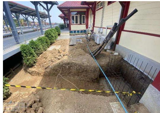
บริเวณสถานีกุยบุรี