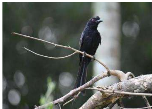
นกแขวงแขวหางบัวใหญ่ ( Dicrurus paradiseus )