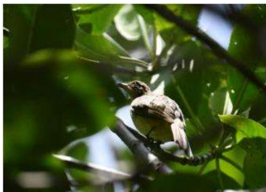
นกปรอดสวน ( Pycnonotus blanfordi )