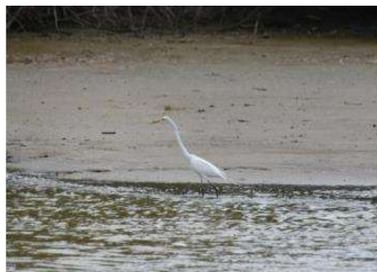
นกยางโทนใหญ่ (Casmerodius albus)