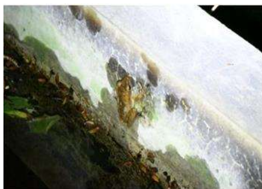
ปาดบ้าน ( Polypedates leucomystax )